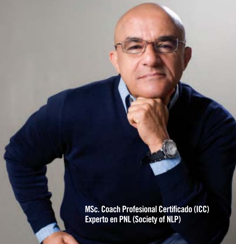
MSc. Coach Profesional Certificado (ICC) Experto en PNL (Society of NLP)

INTEGRIDAD • RESPONSABILIDAD • CRITERIO PROFESIONAL